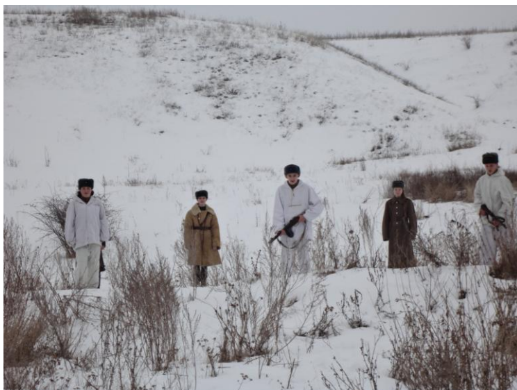
Появление Советских разведчиков (эпизод исторической реконструкции)

Следующий эпизод реконструкции воссоздал появление лыжной группы советских солдат в маскировочных белых костюмах, занявших позиции снежных траншей для возможного отражения атаки немецких войск со стороны с. Хмелевое.