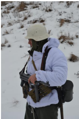
Экипировка офицера немецкой армии

Особый интерес у наблюдателей вызвала реконструкция эпизода боя в центре с. Большая Халань с применением винтовок Мосина основного оружия солдат советской армии первой половины Великой Отечественной войны.