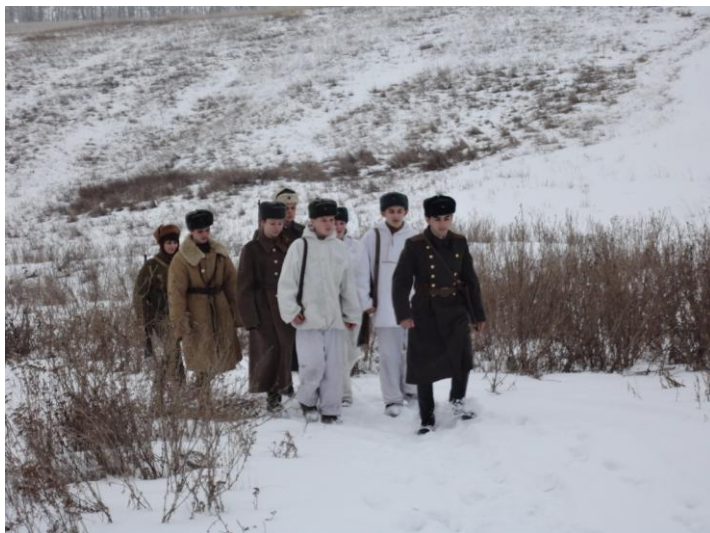
Вход Советских солдат в село Большая Халань (эпизод исторической реконструкции)

Природа сопутствовала участникам реконструкции. Старожилы села вспоминали, что в тот далекий февраль 1943 года зима была снежная и с лютыми морозами. Они отметили, что юным участникам реконструкции удалось максимально точно воссоздать события тех военных лет. Жители села смогли еще раз пережить волнующие минуты радости освобождения родного села от немецко-фашистских захватчиков.